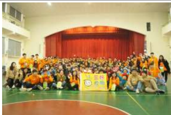
照片說明：全體工人及小朋友與三好布旗拍照。