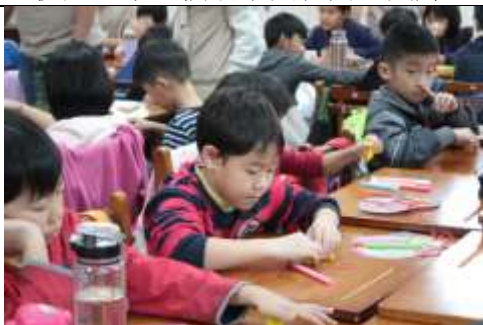
照片說明：參與學生們於課堂上認真 DIY 簡易音階管樂器