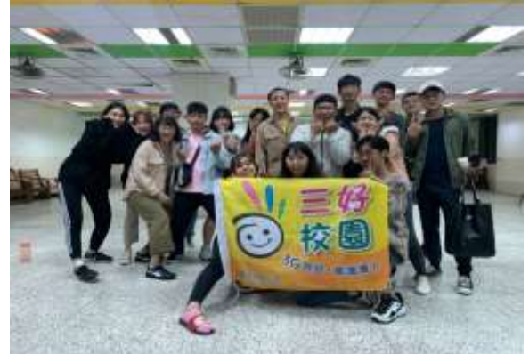
照片說明：雄友會幹部合照