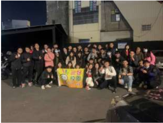
照片說明：全體工作人員大合照