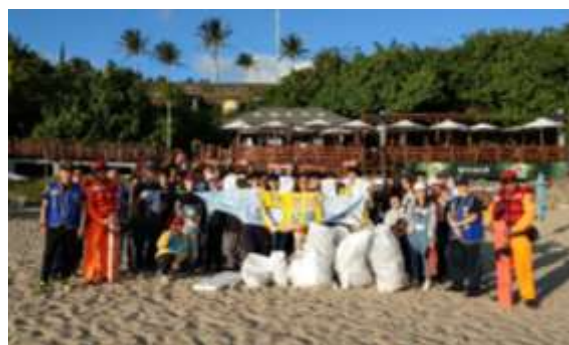
照片說明： 第一天和海巡署在小灣淨灘完的大合照。