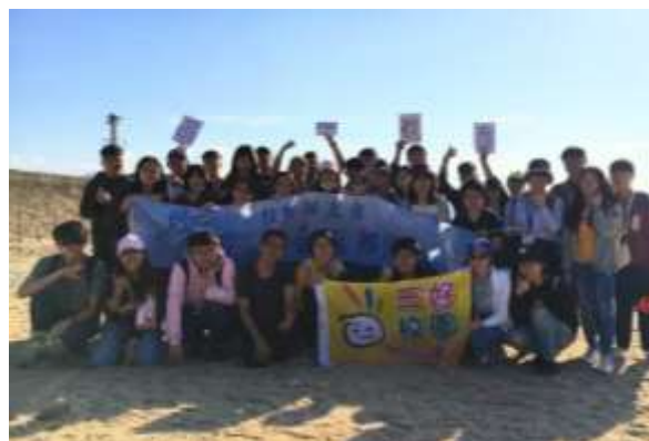
照片說明： 第三天早上大家先去後壁湖港口的星沙灣拍大合照。