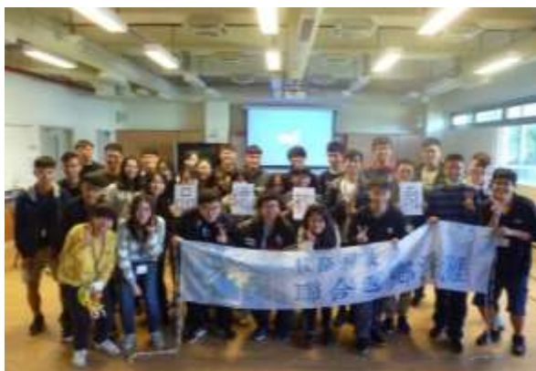
照片說明： 全體學員於海生館後場教育中心聽完演講後大合照。