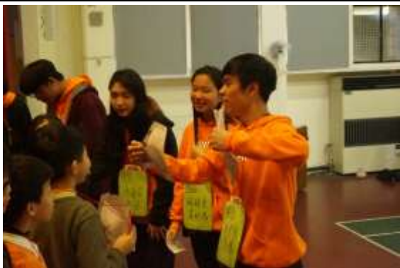
照片說明：毒品外觀及食用後症狀教學。