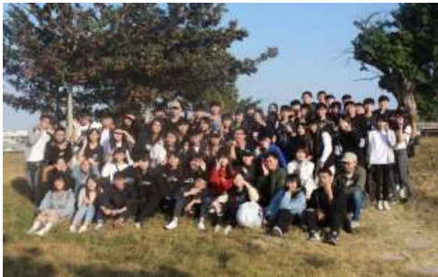
照片說明：返鄉服務全體工人合影

這是活動的幹部們在出發前討論如何執行三好校園計畫的照片，我們希望能教好小朋友課本之外的行為語言談。