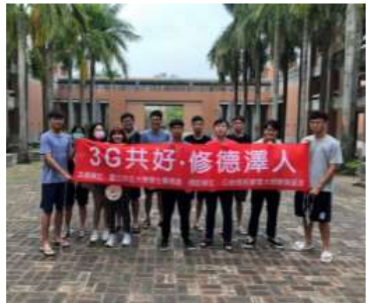
照片說明：工作人員與「3G 共好，修德澤人」的布條合照。