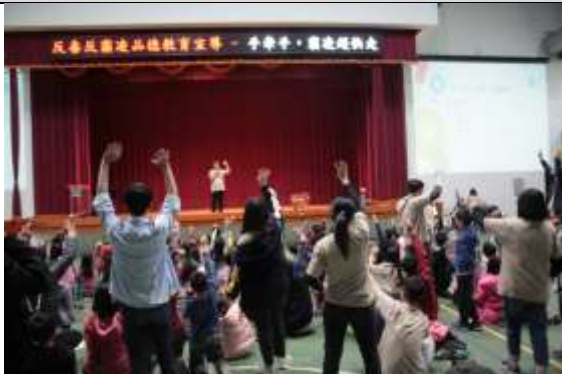
照片說明：品德教育課程一手牽手，霸凌趕快走；學生們踴躍回答問題圖片