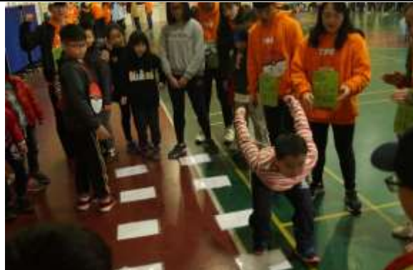
照片說明：反霸凌遊戲。