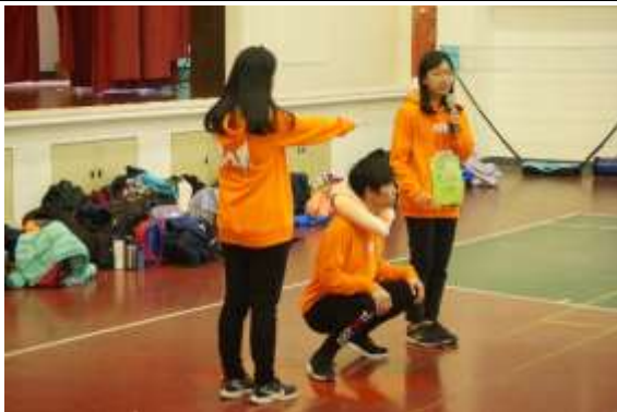
照片說明：地震宣導教授保命三步驟：趴下、掩護、穩住。