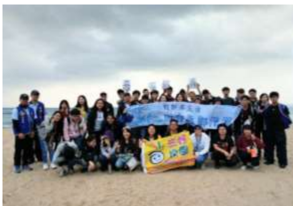
照片說明： 最後一個海灘-大灣，全體與海巡署大合照。