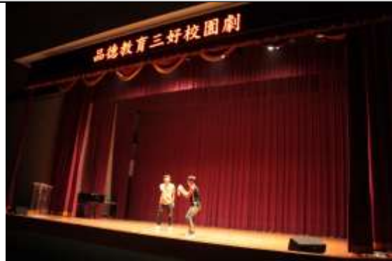
照片說明：3G 共好計畫，藉由獨特的戲劇演出演示三好校園的核心和做法