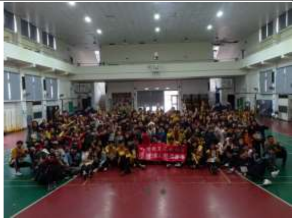
照片說明：經過宣導與課程之後，小學員們對於自身的品德培養有更進一步的認知與學習