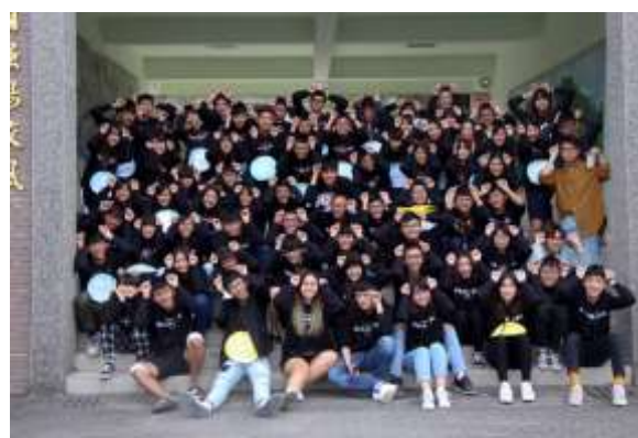
照片說明：這是這次返鄉服務活動所有的工作人員