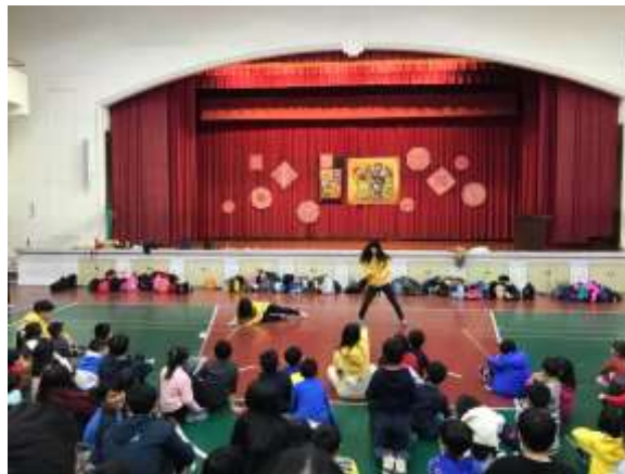
照片說明：工人將議題以戲劇方式呈現給小朋友，除了能提高小朋友的專注力，也能加深學習印象。