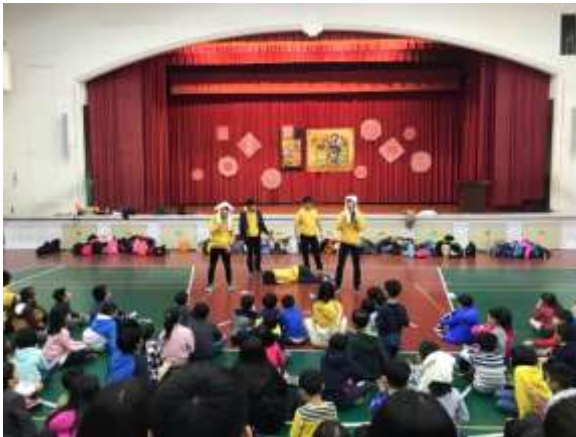
照片說明：有獎徵答完後，再次向小學員宣導正確觀念