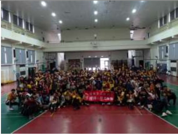
照片說明：經過品德教育宣導後，所有學員與工人合影