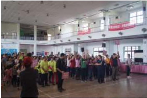
照片說明： 社區聯合成果發表活動約 300 人參加，由中正大學 30 位志工協助活動之進行。