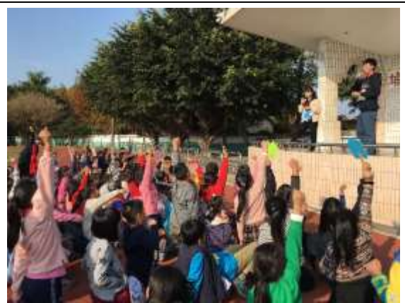
照片說明：小朋友熱情的參與台上的活動。