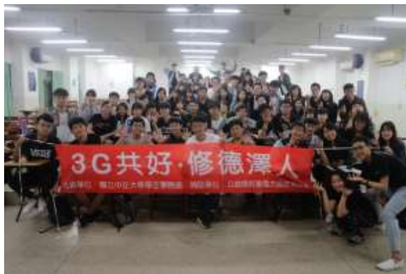
照片說明：3G 共好，修德澤人