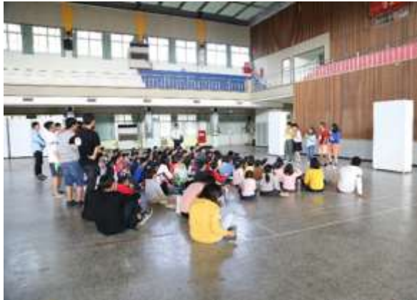
教學戲劇之不能說謊。