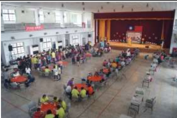
照片說明： 用餐區之協助及服務。