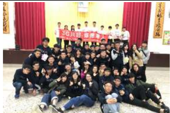
照片說明：工人們與「3G共好，態度為本」的布條合照。