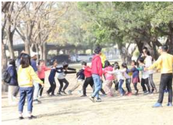
小學員認真玩著 RPG 遊戲。