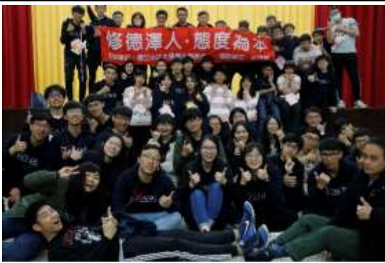
照片說明：工人們與「修德澤人，態度為本」的布條合照。