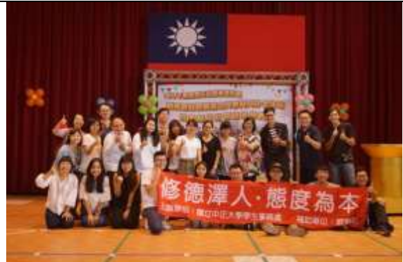
照片說明： 志工之合照。