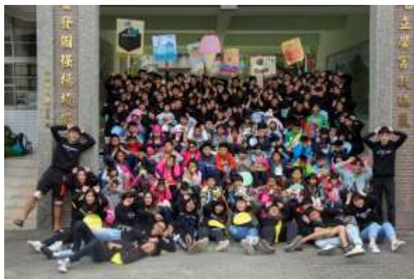
照片說明：這是最後一天跟小孩子的合照