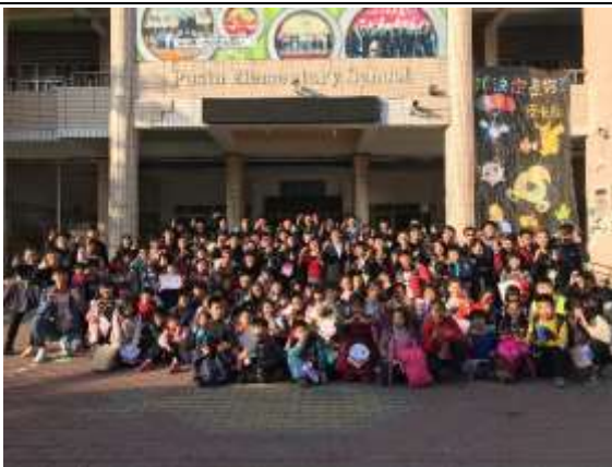
照片說明：活動最後小朋友與校長和主任以及工人的合照