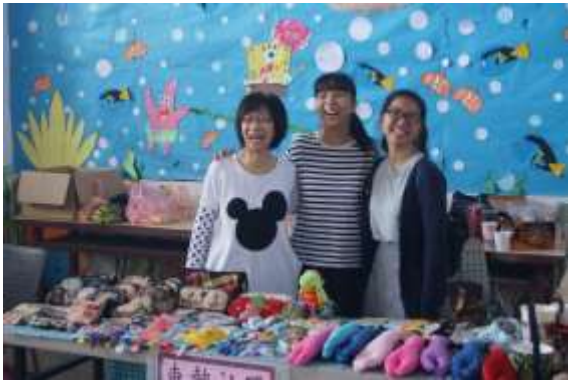
照片說明： 成果展示區之協助及服務。