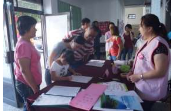
照片說明： 報到區之協助及服務。