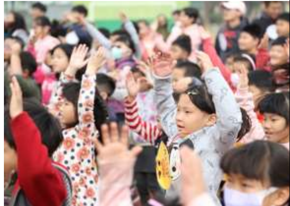
小學員認真地跳著早操。