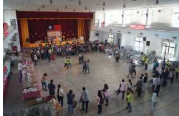
照片說明： 發表會動態活動之協助及服務。