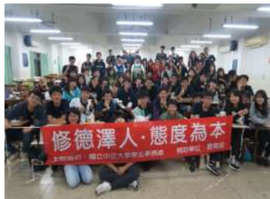
照片說明：修德澤人，態度為本